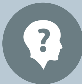
À venir Coordonnateur(trice) de la Route des Sommets